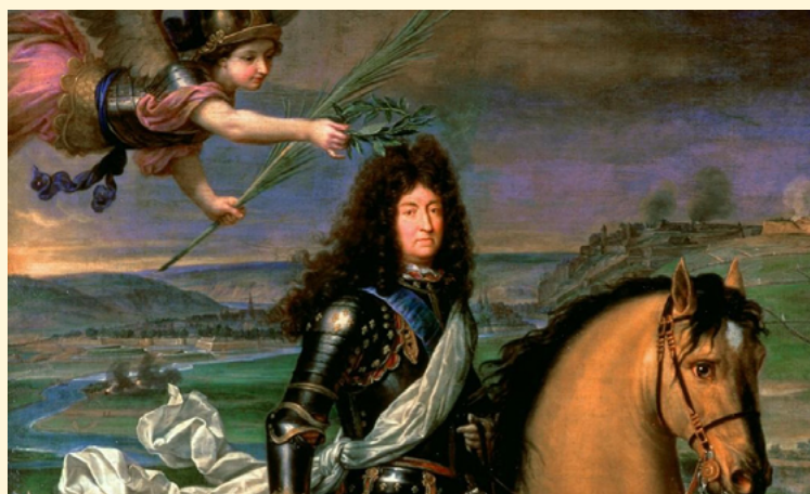
Luis XIV, "el Rey Sol", por Pierre Mignard.